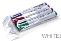
(SETFIXWB) MARKER PENS WHITEBOARDMARKER-SET